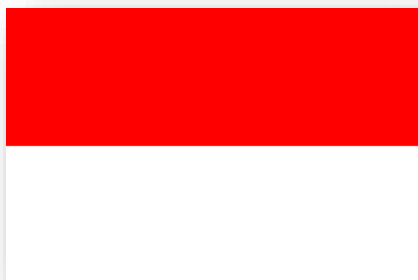
Bandiera di Vienna