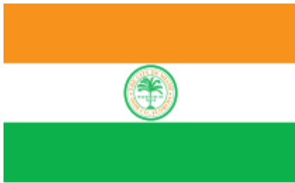
Bandiera di Miami