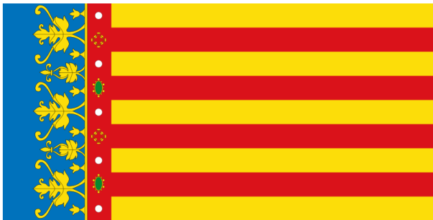
Bandiera di Valencia