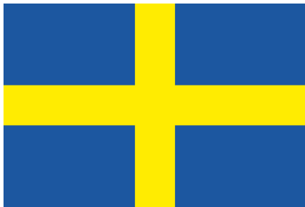
Bandiera di Verona