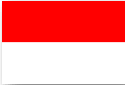
Bandiera di Vienna